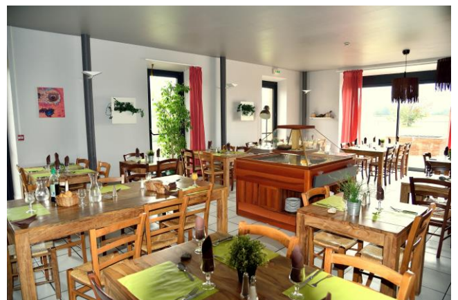
SALLE DU RESTAURANT

Domaine de Garabaud Tous les midis en semaine Menu du jour à 12,50 €