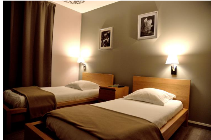
CHAMBRE TWIN (55 €) SINGLE (42 €)