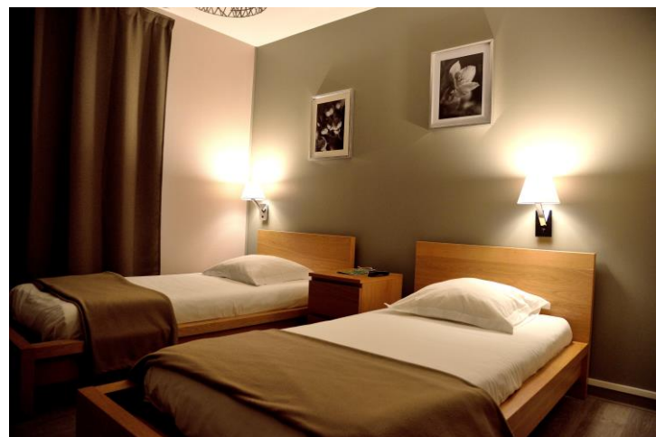
CHAMBRE TWIN (55 €) SINGLE (42 €)